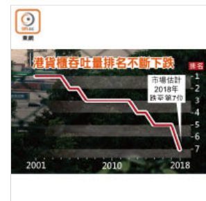
港貨櫃吞吐量排名不斷下跌